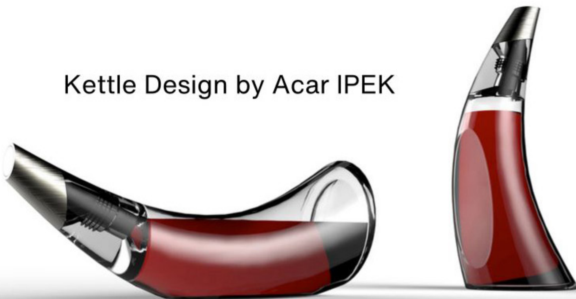
Kettle Design by Acar IPEK