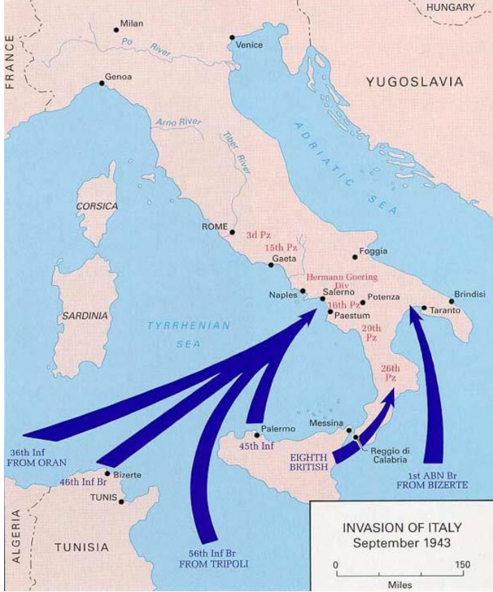
Harita 2.1. İkinci Dünya Savaşı Sırasında İtalya'nın İşgali (UTL 2016)