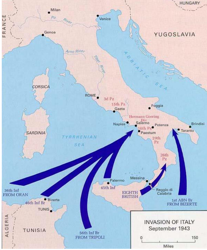
Harita 2.1. İkinci Dünya Savaşı Sırasında İtalya'nın İşgali (UTL 2016)